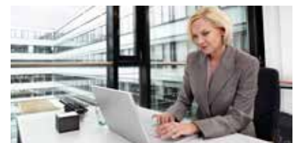
Maximaler Investitionsschutz dank einfach programmierbarer Benutzermedien.