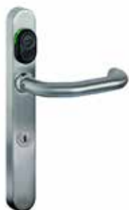
Kaba c-lever Türbeschlag mit TouchGo- und RFID-Funktion

Auch hier bleiben keine Wünsche offen, denn der Kaba c-lever mit Kaba TouchGo- sowie RFID-Funktion wird nahtlos in die bestehenden Kaba Sicherheitskonzepte eingebunden. Ihr System bleibt so sicher, wie es bereits war: Kaba TouchGo ist eine Komfortoption, die keinen Einfluss auf Ihr Sicherheitsdispositiv hat und höchsten Investitionsschutz garantiert.