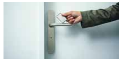
Einfache Programmierung über den Türdrücker